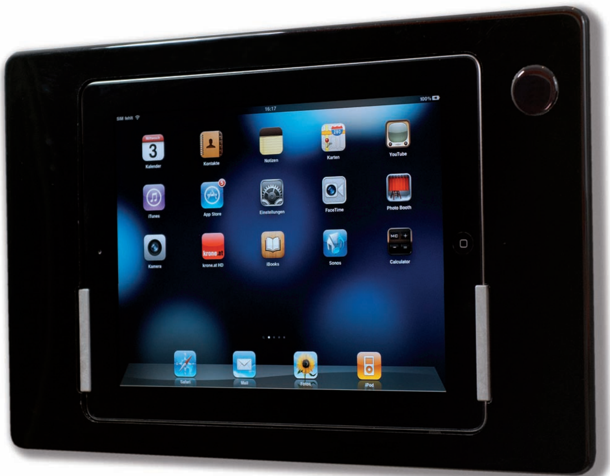
iRoom's iDock Landscape