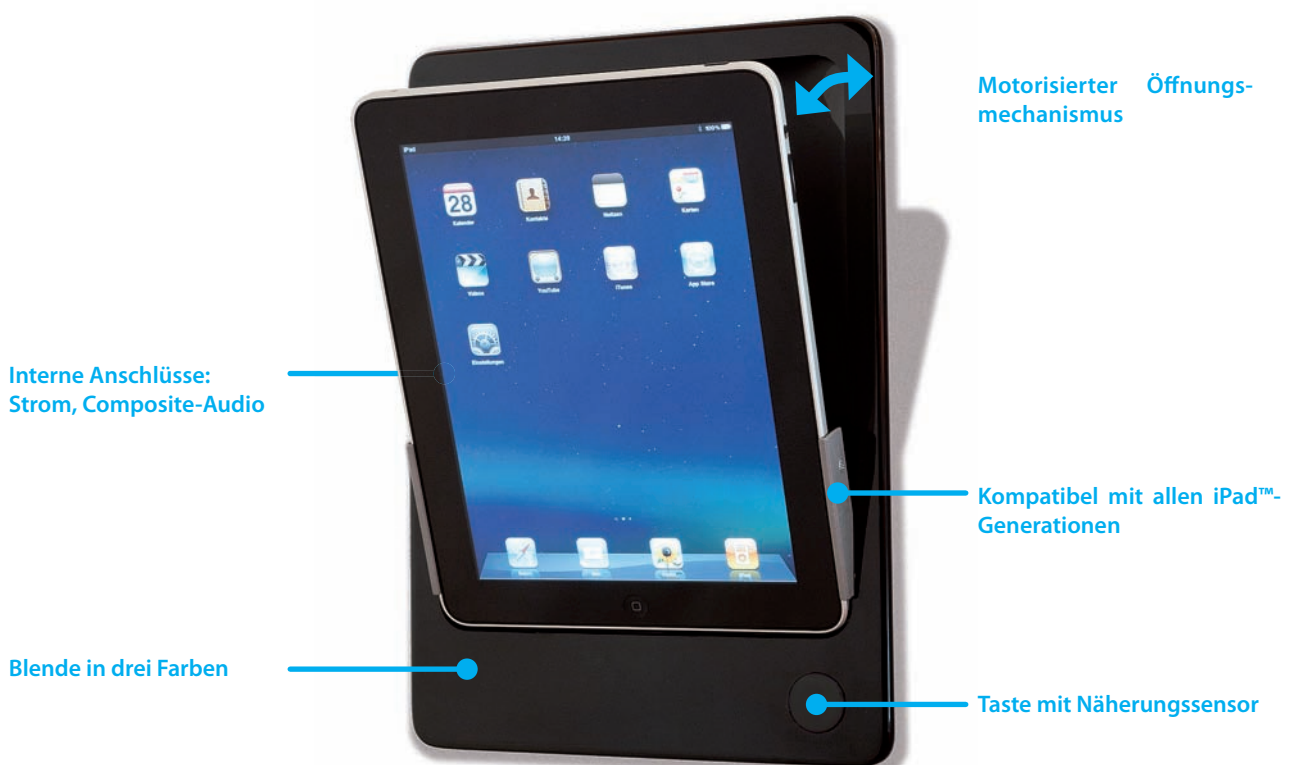
iRoom's iDock Portrait

iRoom's iDock wird unter Einhaltung striktester Qualitätsstandards in Salzburg, Österreich gefertigt. Jedes einzelne Gerät durchläuft eine detaillierte Qualitäts- und Funktionalitätsprüfung. iRoom bündelt all seine Kompetenzen – von Rapid-Prototyping bis hin zur seriellen Fertigung – an einem Standort. Dadurch kann auf die Bedürfnisse des Marktes und technische Gegebenheiten schnell und kundenorientiert reagiert werden. – Alle iRoom-Produkte verfügen über eine 2-Jahres-Garantie.